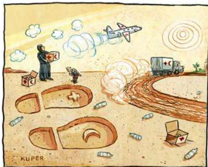
© Peter Kuper / Cartoon Collections

Un aspecto importante de la Respuesta ecológica es el reconocimiento de que una respuesta humanitaria ecológica debe reforzar y no socavar los compromisos para aumentar la inversión en el liderazgo, la entrega y la capacidad de los actores locales. Los requisitos y normas de cumplimiento más estrictos deben ir acompañados de un apoyo a largo plazo y un financiamiento previsible a fin de fortalecer políticas y procedimientos para la sostenibilidad climática y medioambiental, al mismo tiempo que se fortalecen y conservan las capacidades locales. Por lo tanto, un objetivo clave de la Respuesta ecológica es apoyar a las Sociedades Nacionales más pequeñas para fortalecer su sostenibilidad ambiental y ecologizar sus actividades, estableciendo asociaciones relevantes con actores medioambientales y otros socios en el país, así como a nivel internacional.