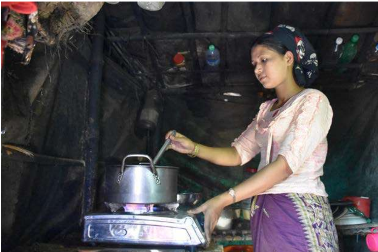
Bangladés. El ACNUR distribuye cocinas y cilindros de gas licuado del petróleo (GLP) a la población refugiada en Bangladés.

veces en el ámbito de las actuaciones de cobijo y artículos no alimentarios. Más aún a pesar de que la madera se utiliza no solo para cocinar los alimentos que fueron distribuidos, para conservar los alimentos o para purificar el agua a través de la ebullición, sino que también se vende como una actividad generadora de ingresos (Grupo URD, 2017).