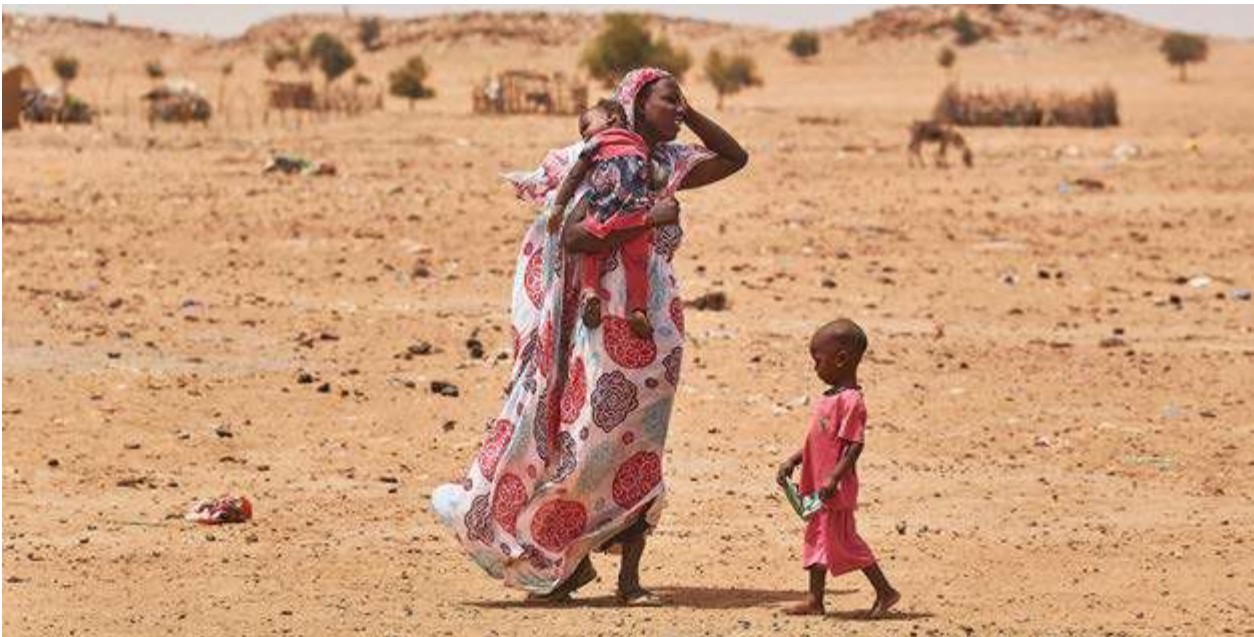
Este de Chad

comienzo de la crisis en 2004, la población refugiada tuvo que alejarse cada vez más de los campamentos, hasta 20 km, para encontrar madera. La sobreexplotación de los recursos naturales dio lugar a tensiones y conflictos entre las comunidades de acogida y la población refugiada.