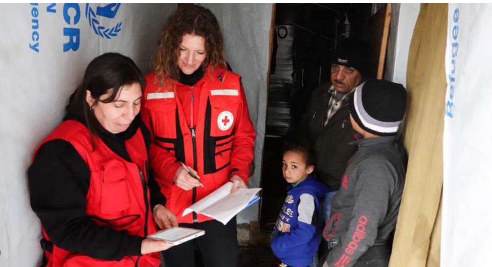
Evaluación ambiental en el Líbano. © Amanda George