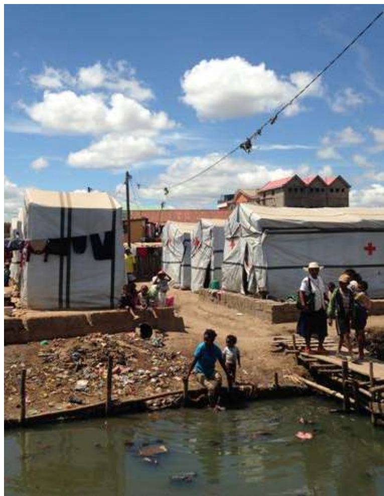
Inundaciones en Madagascar

La experiencia del CICR nos permite comprender que llevar a cabo la evaluación de la huella de carbono es un proceso