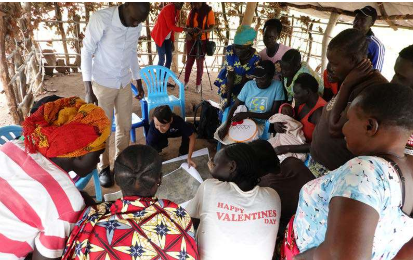
Campamento de población refugiada en Uganda.