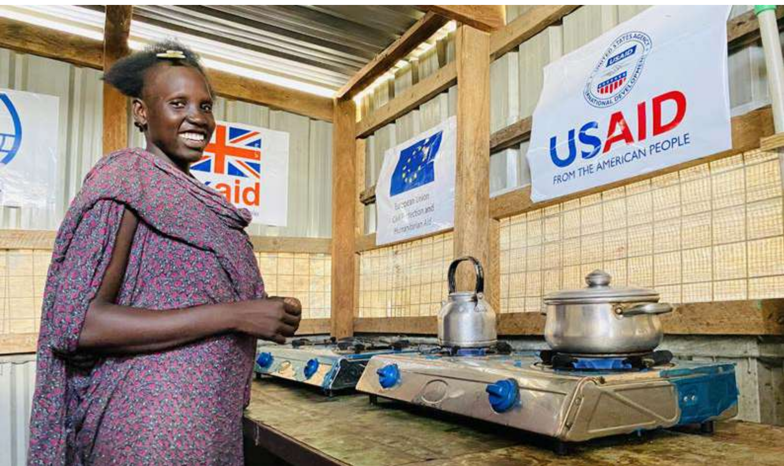
Mujer desplazada cocinando con biogás producido a partir de lodos fecales tratados en el PoC de Malakal.