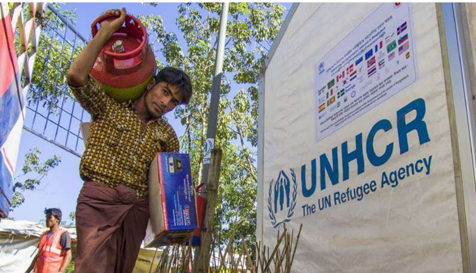
Bangladés. Un suministro de combustible más seguro y sostenible para la población refugiada rohingya.