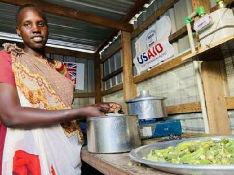
Mujer desplazada cocinando con biogás producido a partir de lodos fecales tratados en el PoC de Malakal.