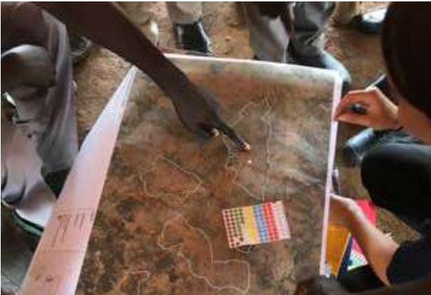
Campamento de población refugiada en Uganda.

considerarse demasiado generales o demasiado obvias, o fuera del alcance de la labor humanitaria básica (p. ej., la realización de una evaluación ambiental completa).