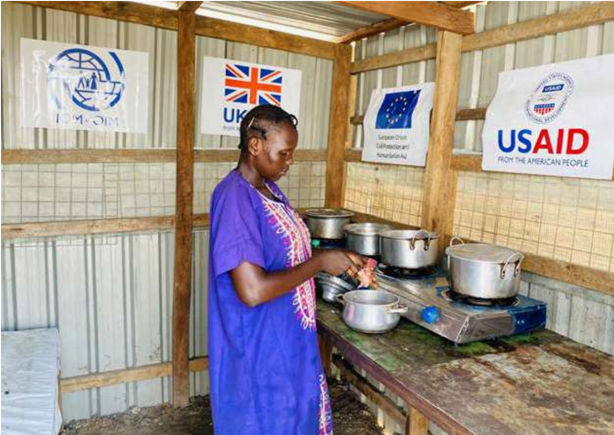
Mujer desplazada cocinando con biogás producido a partir de lodos fecales tratados en el PoC de Malakal.

El proyecto de biodigestores anaeróbios implementado por la OIM 2 en el segundo campamento de desplazados internos más grande de Sudán del Sur 3 aborda tanto las cuestiones relacionadas con WASH como con la energía en un contexto operativo desafiante. Estos biodigestores utilizan una cámara hermética en la que se almacenan y tratan los excrementos. Gracias a un proceso de fermentación anaeróbica, los biodigestores producen biogás, que se puede quemar proporcionando energía. Ésta puede ser entonces utilizada para cocinar, iluminar o generar electricidad 4 .