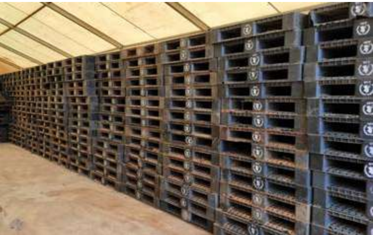
Palés de polietileno de alta densidad (HDPE PEAD)

donde se ejecutan los programas. Las soluciones dependen del contexto y difieren mucho según el tipo de residuo (p. ej., plástico, cartón, metal o residuos electrónicos). Sin embargo, existen oportunidades para reciclar los desechos producidos por las/los actores humanitarios a través de redes de recolección de residuos formales e informales que proporcionan una fuente de ingresos a muchas personas de los países en desarrollo.