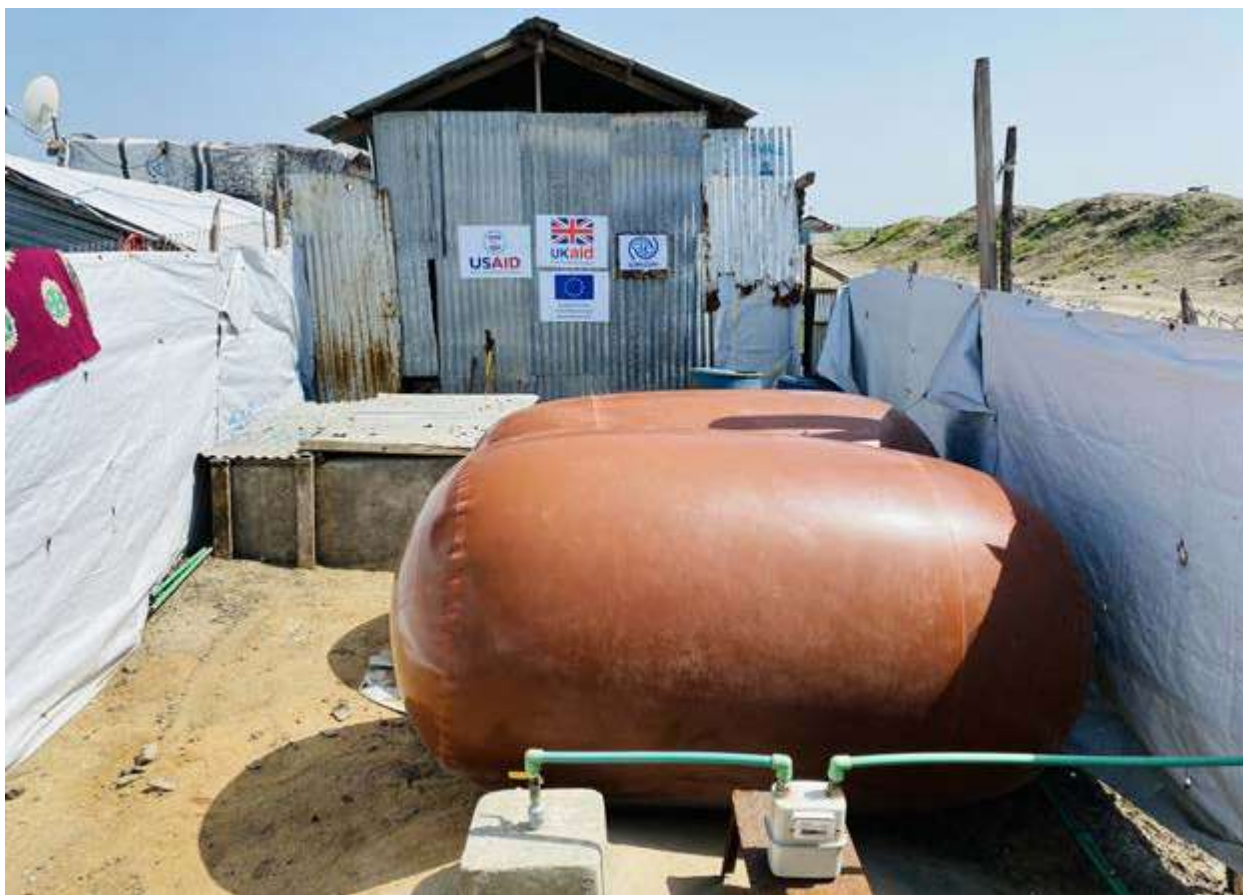
Depósitos de gas llenos de biogás producido a partir de lodos fecales tratados en el emplazamiento de biogás.

Por ello, resulta necesario establecer un sistema de supervisión periódica que recolecte datos sobre la eficiencia de la producción de gas con el fin de realizar los ajustes necesarios (por ejemplo, añadir lodos fecales/ agua). Este es un factor a tener en cuenta si hay rotación de personal para asegurarse de que no haya escasez de capacidad técnica.