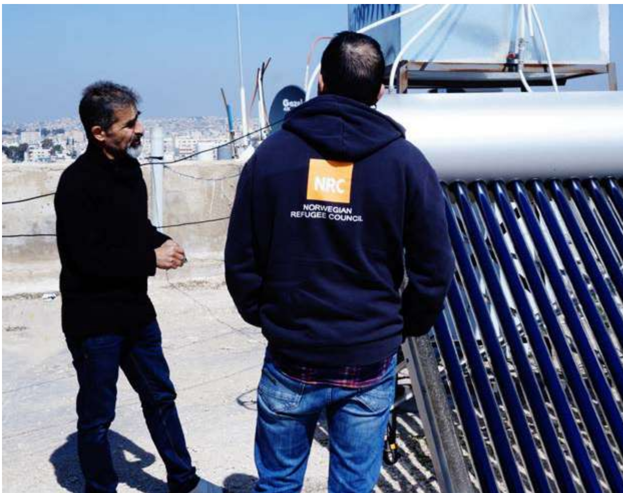
Proyecto de reducción de la pobreza mediante energía renovable para población refugiada (RE4R), instalación de calentadores de agua solares.

relacionados con las cubiertas de plástico, madera utilizada para la construcción de ladrillos, etc.). Del mismo modo, este tipo de proyectos ofrecen una serie de oportunidades para incorporar los temas ambientales y climáticos.