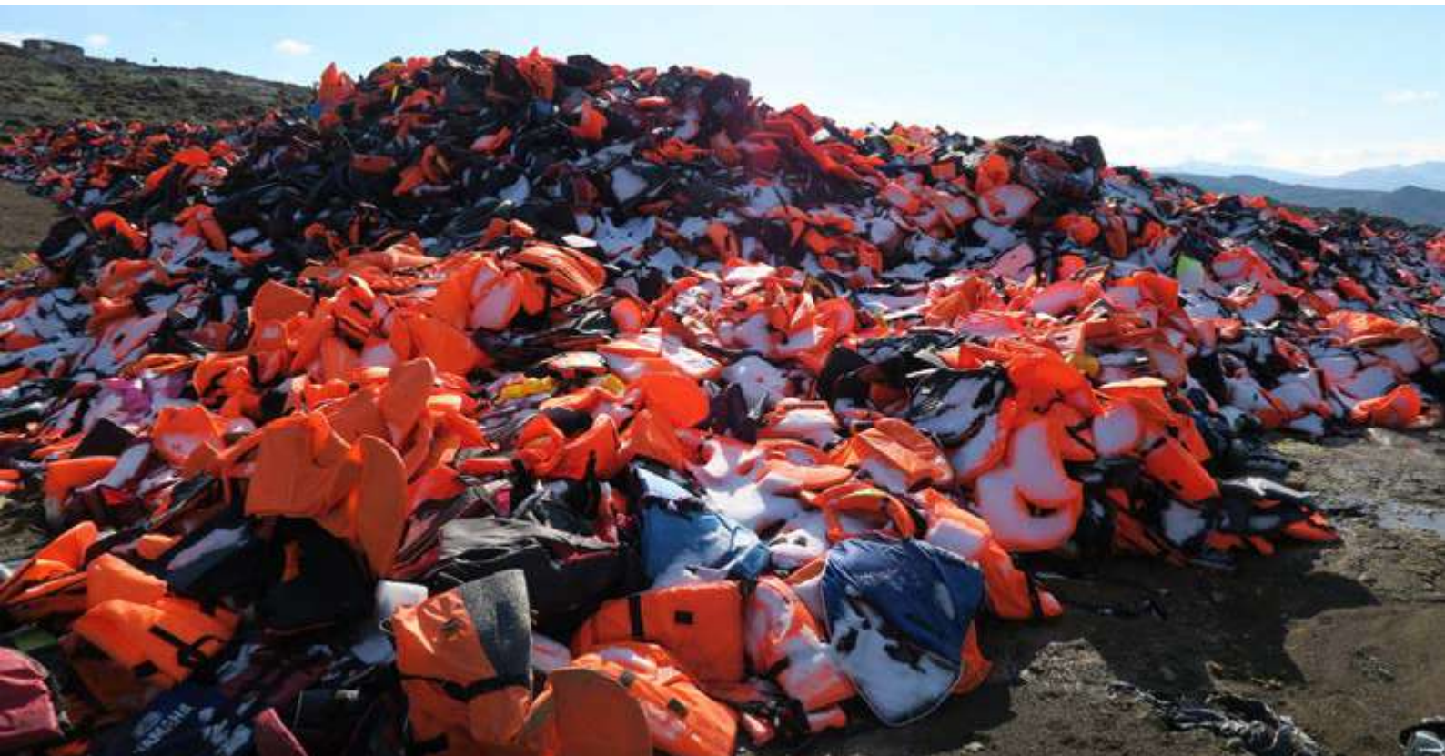
Chalecos salvavidas en Lesbos, Grecia