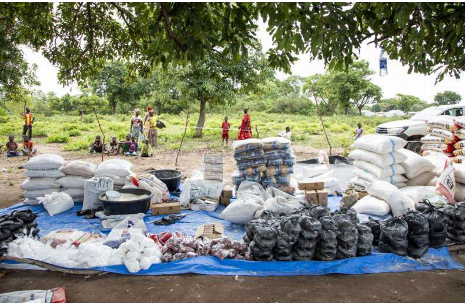
Distribución de alimentos