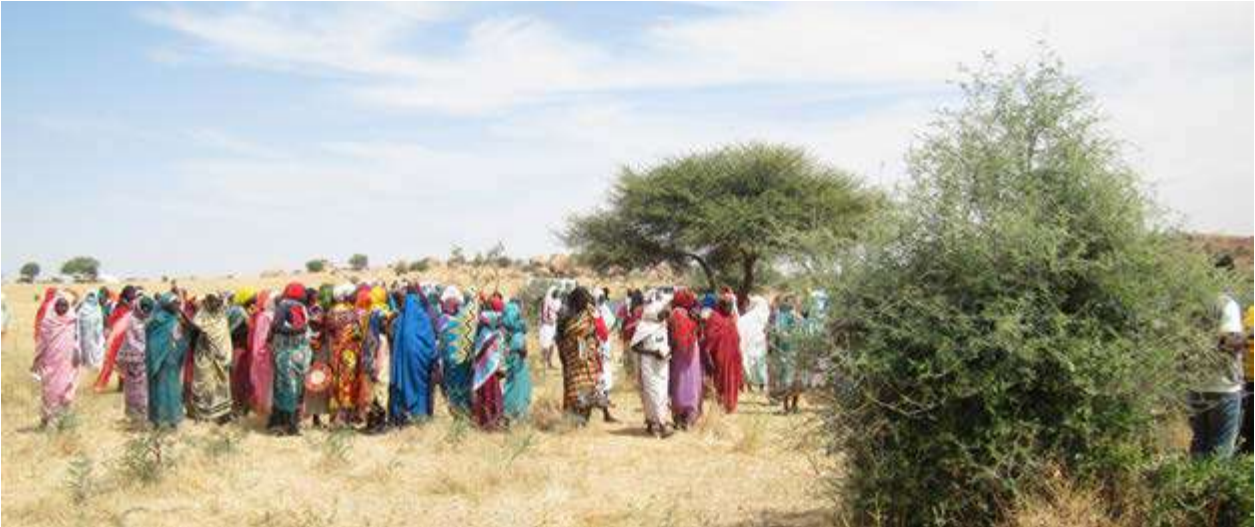
Este de Chad