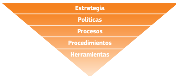
Figura 1: Puntos de entrada para un enfoque medioambiental

La Respuesta ecológica es un enfoque que se ha aplicado gradualmente en todo el Movimiento Internacional de la Cruz Roja y de la Media Luna Roja (desde 2012) y que tiene por objetivo incorporar las consideraciones ambientales en la respuesta humanitaria, las prácticas internas y el trabajo de políticas. El Grupo de Trabajo para una intervención ecológica fue creado por primera vez por la Cruz Roja Sueca y actualmente está dirigido por la Federación Internacional de Sociedades de la Cruz Roja y de la Media Luna Roja (IFRC, por sus siglas en inglés). Cuenta con el apoyo activo del Comité Internacional de la Cruz Roja (CICR), las Sociedades de la Cruz Roja Australiana y Canadiense, así como de otras Sociedades Nacionales según sus esferas de interés específicas. La Respuesta ecológica ha facilitado la aplicación de acciones clave a diferentes niveles y, por lo tanto, ha contribuido significativamente a generar cambios.