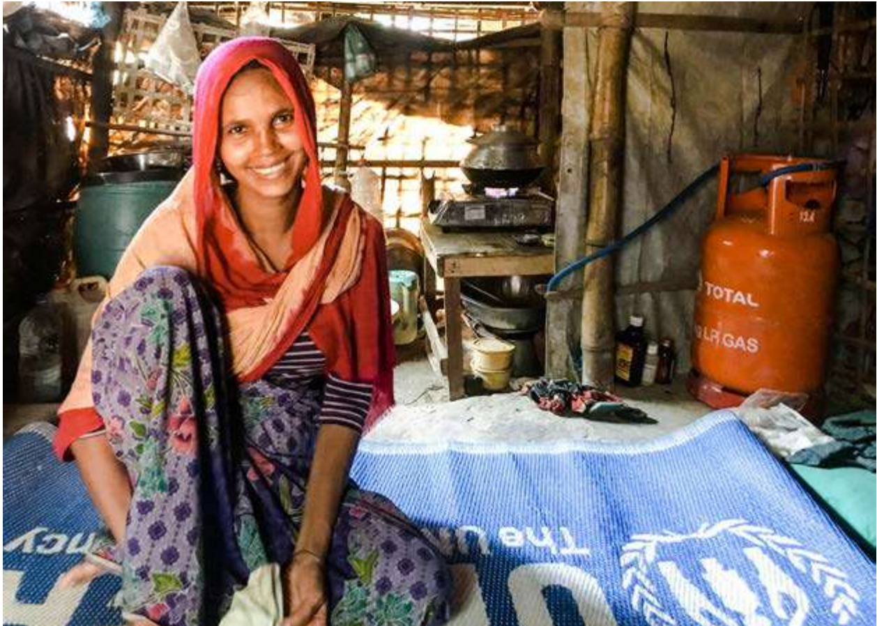
Bangladés. El programa de gas envasado alivia la crisis de combustible para la población refugiada rohingya.

contextos, el GPL podría ser menos fiable y menos accesible. Aunque el contexto de Bangladés ayudó a que el proyecto fuera un éxito, este podría no ser el caso en otros lugares. Por tanto, es muy importante colaborar con las autoridades locales y nacionales para garantizar la coherencia con la estrategia energética nacional. También es necesario disponer de un plazo mínimo de ejecución (1 año) para analizar correctamente el mercado, capacitar a las personas beneficiarias (cuando sea necesario) y combinar el proyecto con actividades de medios de vida para que puedan comprar las recargas de GPL (particularmente para la comunidad de acogida). De lo contrario, existe el riesgo de que la solución no pueda mantenerse a largo plazo. Además, una idea que habría que explorar para mejorar la eficiencia del programa podría ser el ajustar el volumen de los cilindros en función de la composición de los hogares y su consumo, en vista de que ello puede tener considerables repercusiones logísticas creando una percepción errónea entre quienes lo usan que será necesaria abordar.