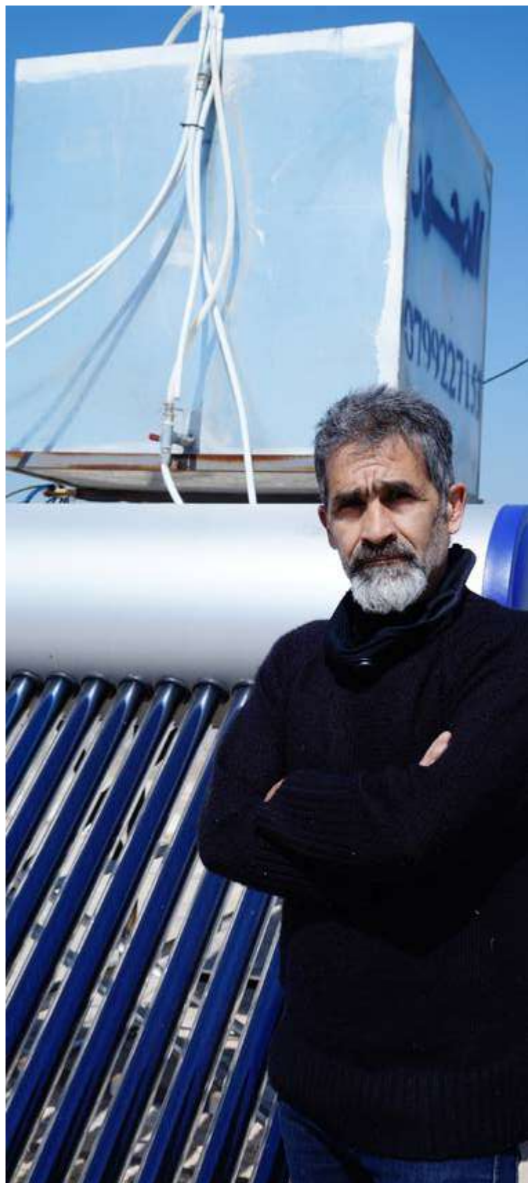
Proyecto de reducción de la pobreza mediante energía renovable para población refugiada (RE4R), instalación de calentadores de agua solares.

El acceso a la energía para cocinar, tener calefacción e iluminación son aspectos del derecho a una vivienda adecuada 14 para el que las personas desplazadas enfrentan obstáculos especiales. Mediante la mejora de los refugios, NRC ha facilitado el acceso a los mismos a la vez que ha reducido su huella de carbono. A medida que crece la preocupación medioambiental, NRC continúa buscando formas de ayudar a las personas a garantizar unas condiciones de vida adecuada durante las diferentes etapas del desplazamiento, mientras que integra criterios de consumo de energía sostenible.